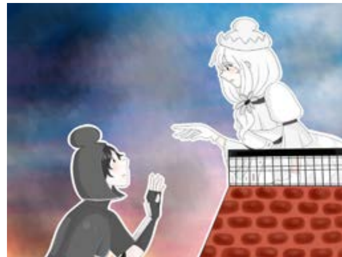
Dbujado por: Deborah Tolentino

https://www.youtube.com/watch?v=IXI_WYrYHaQ