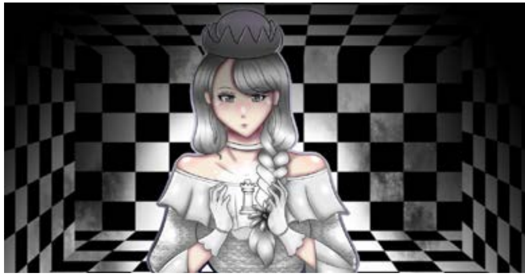
Dbujado por: Deborah Tolentino